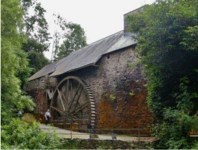
Melin Ddŵr Ffwrnais, Sir Geredigion.

Roedd melin ddŵr yn adeilad mawr wedi'i hadeiladu o bren neu garreg.