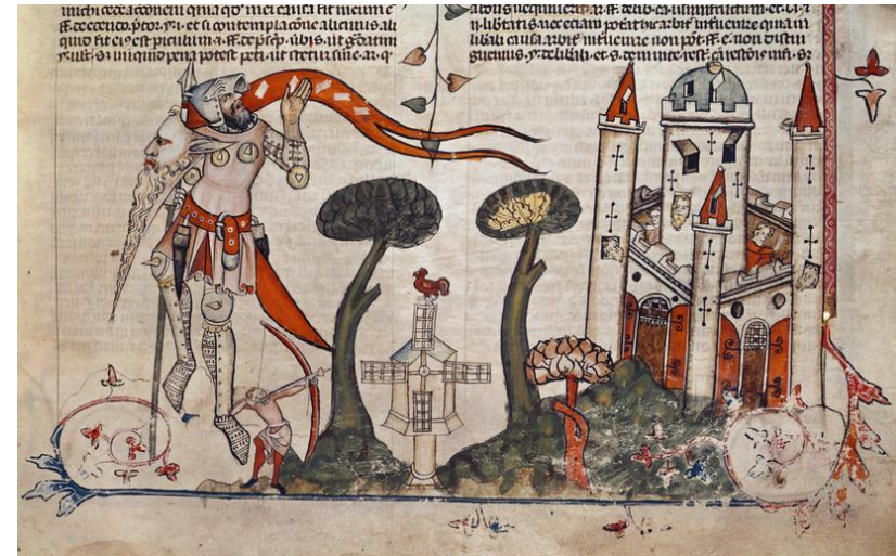
Melin gwynt mewn llawysgrif darluniedig canoloesol, Llun diolch I British Library, Royal 10 E. IV, f.89