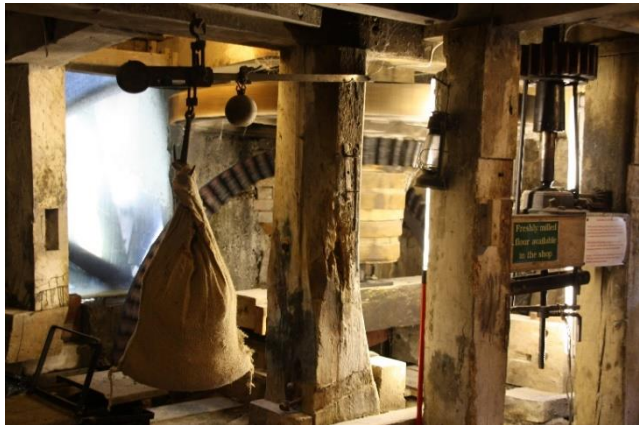
Tu fewn melin ŷd14eg ganrif Lyme Regis

Dyma sut roedd melin ddŵr yn gweithio: roedd yr olwyn ddŵr yn troi siafft fawr syth a oedd yn ymestyn ar draws tŷ'r felin, ac arni roedd cocos gyrru a chogiau i droi'r meini malu. Roedd rhain mewn ystafell ar wahan.